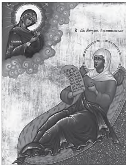
Блаженная Матрона Анемисская. Икона