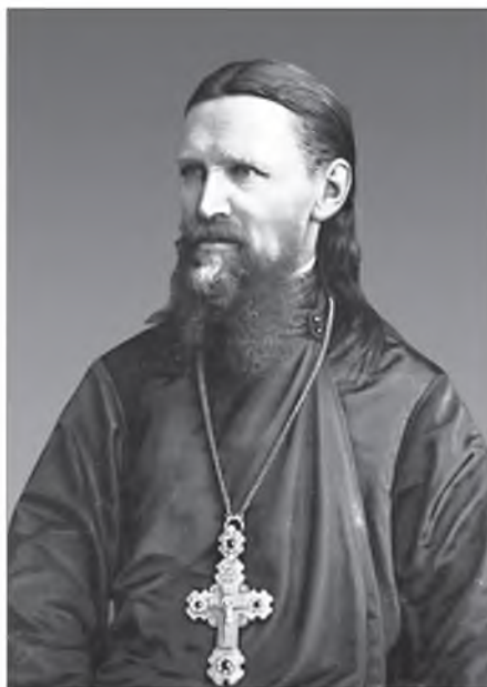
Протоиерей Иоанн Кронштадтский