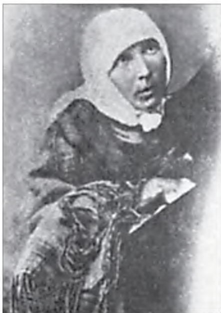
Блаженная Марфа Царицынская