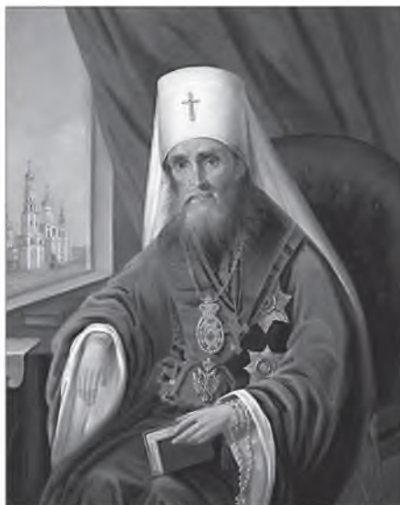
Святитель Филарет Московский

Но чаще ясновидящая сила проявлялась у Юлии Николаевны в состоянии безчувствия. Это происходило с ней после страшных болезненных припадков: сначала ее ломало, корчило так, что сводило голову с ногами и кости хрустели от напряжения, а потом, придя в полное изнеможение, она засыпала. Сон этот, по объяснению игумении Евгении, «был не что иное, как благодатное состояние» 2 . В это время Юлия