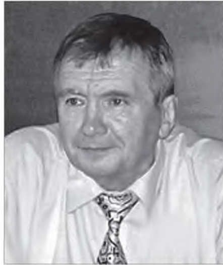
Александр Сергеевич Панарин

Н. С. Трубецкой одним из первых раскрыл всю драматичность догоняющего развития и всю тщету его: «...оказывается, что культурная работа европеизированного народа поставлена в гораздо менее выгодные условия, чем работа природного романо-германца. Первому приходится искать в разных направлениях. Тратить свои силы над согласованием элементов двух разнородных культур, над согласованием, сводящимся большей частью к мертворожденным попыткам; ему приходится выискивать подходящие друг к другу элементы из груды ценностей двух культур – тогда как природный романо-германец идет верными путями, проторенной дорожкой, не разбрасываясь и сосредоточивая свои силы лишь на согласование элементов одной и той же культуры... Как человек, пытающийся идти в ногу с более быстроходным спутником и прибегающий с этой целью к приему периодических прыжков, в конце концов неизбежно выбьется из сил и упадет в изнеможении, так точно и европеизированный народ, вступивший на такой путь эволюции, неизбежно погибнет, безцельно растратив свои национальные силы. И все это – без веры в себя, даже без подкрепляющего чувства национального единства, давно разрушенного самим фактом европеизации» 1 .