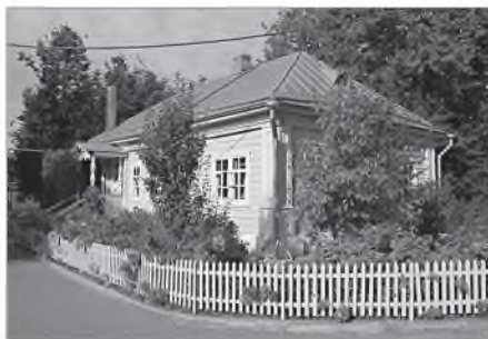
Домик-келья блаженной Паши Дивеевской