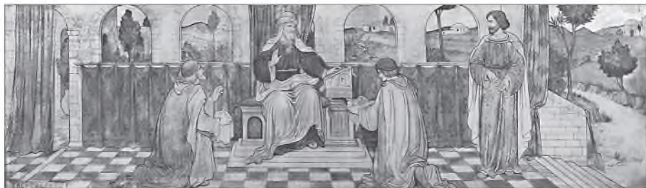
Притча о талантах. Худ. Фредерик Джеймс Шилдс

телей не сидел, но в законе Господни воля его, и в законе Его поучится день и ночь. И будет яко древо, насажденное у истока вод, которое плод свой даст во время свое, и лист его не отпадет, и все, что творит, успеет (см. Пс. 1, 1 – 3).