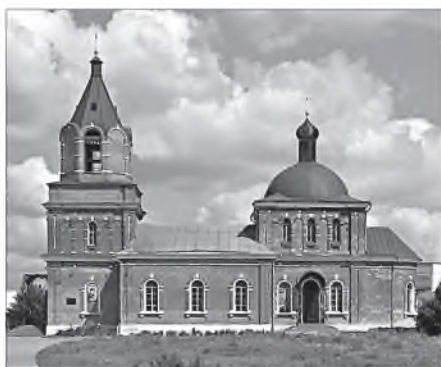
Храм прп. Сергия Радонежского в селе Бусиново