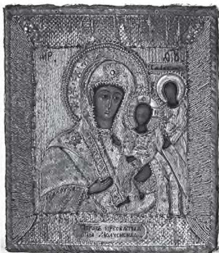
Чудотворная икона Божией Матери «Молченская». XIV – XVI вв. Шитье бисером и жемчугом. Бусиново

Записано со слов С. А. Волковой 2 ноября 1931 года