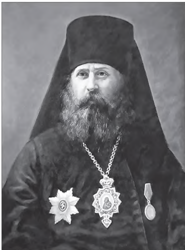
Архиепископ Александр (Трапицын), портрет

что и ты, ангел Владимирской Церкви, преосвященный владыко, милостивейший архипастырь и отец, не оставишь меня своими мудрыми указаниями и советами и научишь меня ходить достойно высокого епископского звания. Смиренно предстоя пред вашим святейством в притрепетном ожидании возложения на меня ваших святительских рук, я усерднейше прошу и умоляю вас, святейшие архипастыри и отцы, помолиться обо мне недостойном, да Божественная благодать уврачуется во мне немощное и оскудевающее восполнит.