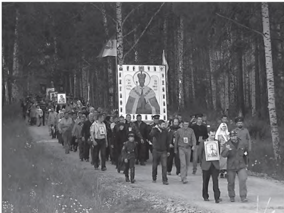
Царский Крестный ход от Храма на Крови до монастыря в честь святых Царственных страстотерпиц в Екатеринбурге

Народ, оставшийся верным Богу, вернулся к своим корням, стал восстанавливать историческую Россию – Святую Русь. Население же бросилось зарабатывать деньги и распродавать Родину. Народ строил храмы, восстанавливал монастыри, крестился, исповедовался, причащался Святых Христовых Тайн, молился и приводил в храм своих детей и внуков. Это время называют вторым крещением Руси.