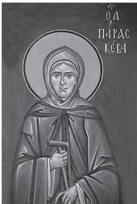
Блаженная Параскева Дивеевская. Икона

Когда в 1918 году я собралась в свою родную деревню Пензенской губернии, побывала я в Дивееве у блаженной Марии. В первый раз в жизни встретила я с таким человеком, странным для меня и непонятным. Все, что она говорила, все подходило к моей жизни. Собираясь уходить, я сказала: «Не могу быть долго в Дивееве, надо ехать». Блаженная на это отвечает: «Поезжай, поезжай с Богом! Тебя ждут, ждут!» – «Никто меня не ждет, я даже не писала, что еду!» – «Ждут-ждут, поезжай!» – повторила она. Даже ее послушница удивилась: кто же это меня ждет? Тогда блаженная перечислила всю деревенскую родню. А я опять в голову ее слова не взяла, зная, что меня не ждут.