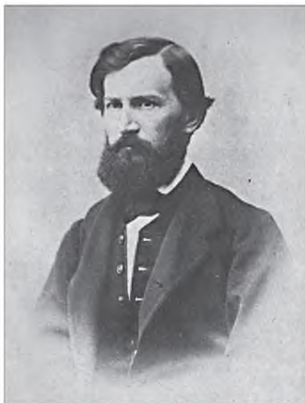
Константин Дмитриевич Ушинский

Сегодня же мы как лебедь, рак и щука. Сопоставьте концепцию духовно-нравственного воспитания личности гражданина России и Федеральную целевую программу развития образования – разные категории, разные целевые ориентиры и разное понимание человека.