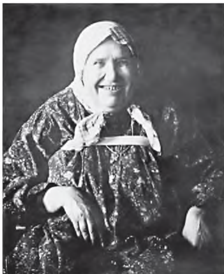
Блаженная Мария Ивановна Дивеевская

Б лаженная Мария Ивановна Дивеевская 1 умерла 25 августа 1931 года, прославляться начала после открытия ее мощей. Если Мария Ивановна куклу вымоет, значит кто-то умрет. Была она одну сестру по отнявшейся руке, которая не чувствовала даже боли, и после этого сестра начала ощущать свою руку.