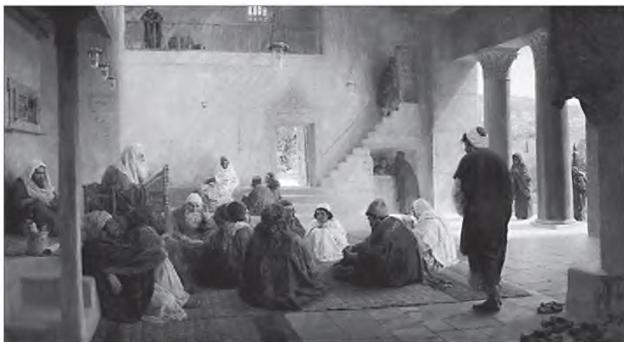
Среди учителей. Худ. В. Д. Polenov. 1896 г.

таланты. Но как быстро рассеиваются таланты детства! Рассыпаются и меркнут в мирской суете. Современные идеи педагогики, увлеченной развитием способностей безотносительно к духовному становлению личности, еще усиливают эту беспощадную суету: «Драмкружок, кружок по фото, хоркружок – мне петь охота» (А. Барто)... Господь дал нам таланты не для увлечений и развлечений, но для служения Ему, служение же требует сосредоточения на одном, единственном Пути. Призвание указывает выход на дорогу служения. В служении Делу, ощущаемому как предметность более ценная, чем страсти нашего «эго», талант осуществляет себя как гений, открывающий новые пути в науках, искусствах, ремеслах, спорте, инженерном и предпринимательском, военном и государственно-служилом, врачебном и учительском деле, – во всех областях человеческой практики. Ибо это Божие дело на земле – творить все новое, совершенное, благое, спасающее людей красотой и добротой от глады, хлады, от малодушия и от бури. В совершенном служении человек послушен Богу, он раскрывает Божий замысел о предмете своего дела, движет его вперед, раздвигая границы возможного.