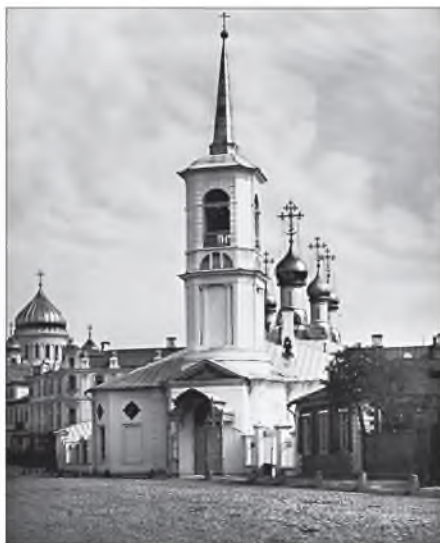
Церковь Воскресения Слоущего на Остоженке

основание посвятить ей, по поводу пятидесятилетия со дня ее кончины, статью по материалам частью уже напечатанным, а частью еще не изданным.