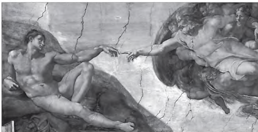
Сотворение Адама. Фреска Микеланджело Буонарроти. Ок. 1511. Сикстинская капелла, Ватикан

В одном документе разговор о духовных ценностях и традициях, в другом – «человеческий капитал» и «человеческий ресурс» – такая инженерия социальная, но никак не антропология.