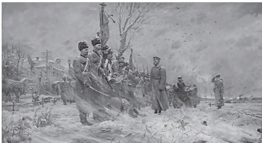
Пощение с Конвоем. Худ. Павел Рыженко

перечислять, но и так написано много книг и статей об этом периоде нашей истории: имеющий уши – слышит, имеющий глаза – видит 1 .